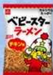
ベビースターラーメン （津市）

両市の名物として、ベビースターラーメン（津市）、なが餅・かぶせ茶のティーバッグ（四日市市）の配布を行います。