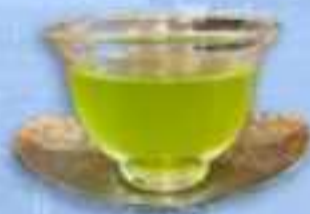
かぶせ茶 （四日市市）