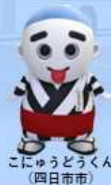
こにゅうどうくん （四日市市）