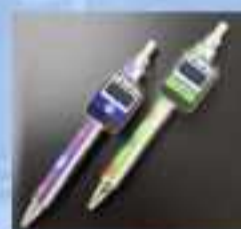
ボールペン （四日市あすなろう鉄道）