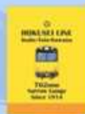
北勢線ノート （三岐鉄道）

※都合により商品を中止または変更する場合があります。 ※商品は数に限りがあるため、なくなり次第終了となります。 ※6/5は 三岐バスと名松線を元気にする会、6/6は 四日市あすなろう鉄道、三岐鉄道、名松線を元気にする会の販売です。