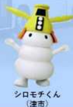
シロモチくん （津市）