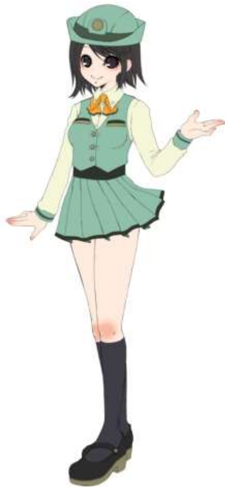
名松線を元気にする会 イメージキャラクター 奥津ハルカ